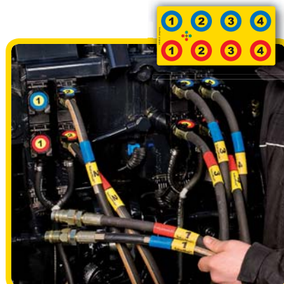
Alltid riktig funksjon!

Sikkerhet oppnås kun ved riktig og komplett bruk av systemet: