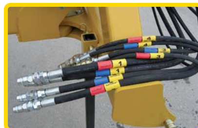
8 stk. slanger kobles riktig på 2 min.

Blå krymp 51/26 mm leveres uten symbol frem til neste produksjon.