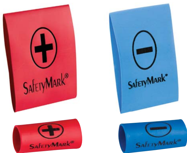
Bildene viser 39/13 mm krymp før og etter krymping.

Krymppehylser leveres i 2 dimensjoner: 39/13 og 51/26 mm