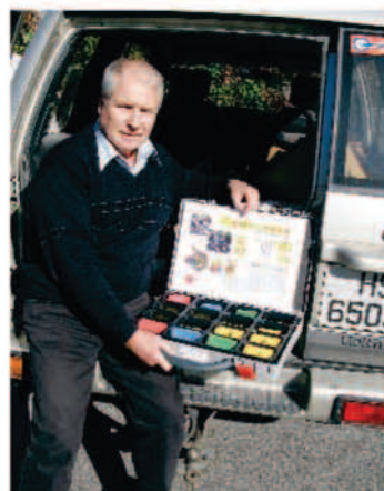
Merkesystemet er samlet i en egen, spesiallaget koffert.